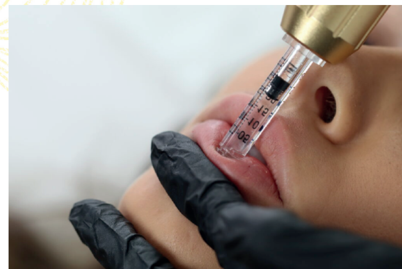
Aumento e hidratación de labios