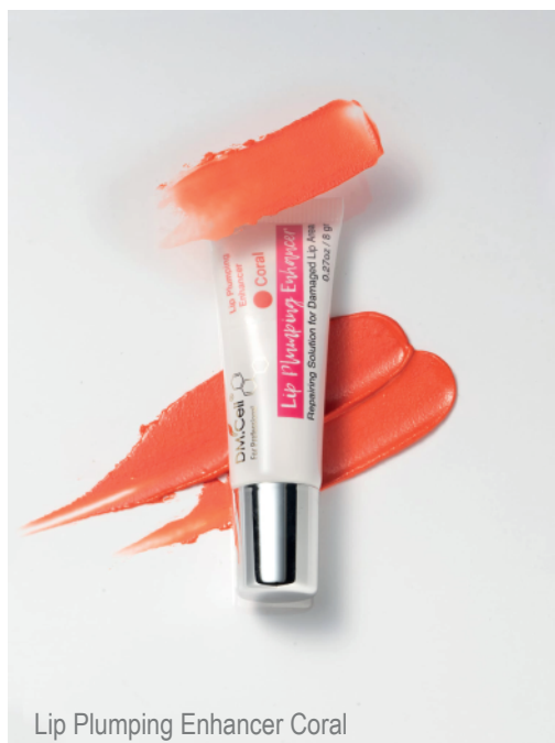
Lip Plumping Enhancer Coral