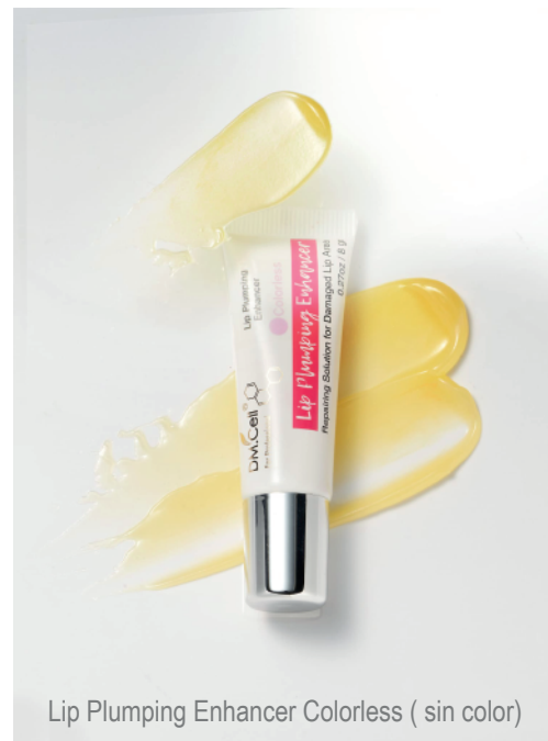
Lip Plumping Enhancer Colorless ( sin color)