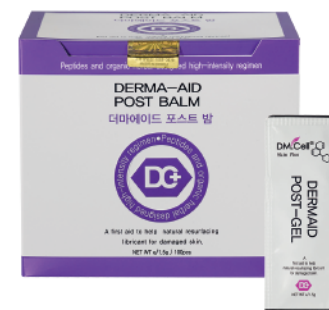
5x Sachet Dermaid Post Balm 1,5gr c/u