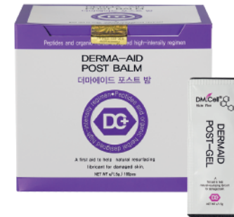
5x Sachet Dermaid Post Balm 1,5gr c/u