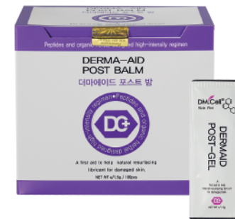
5x Sachet Dermaid Post Balm 1,5gr c/u