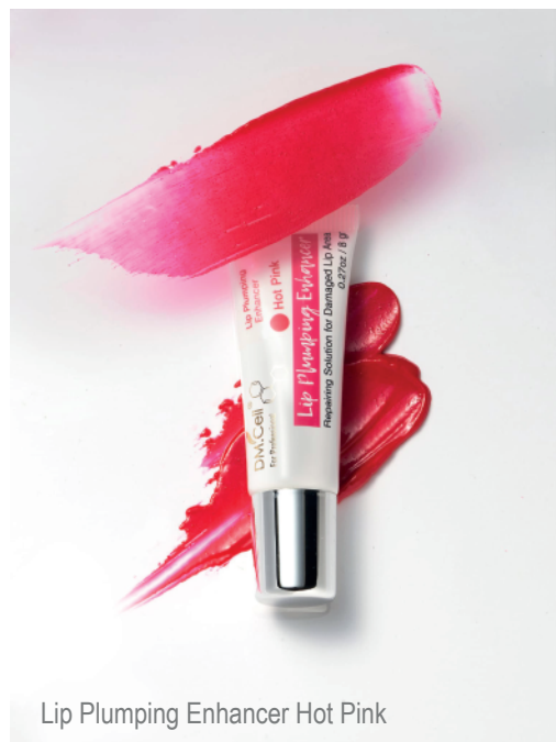
Lip Plumping Enhancer Hot Pink

Protocolo de trabajo Aplicado BBlips Lip Plumping Enhancer