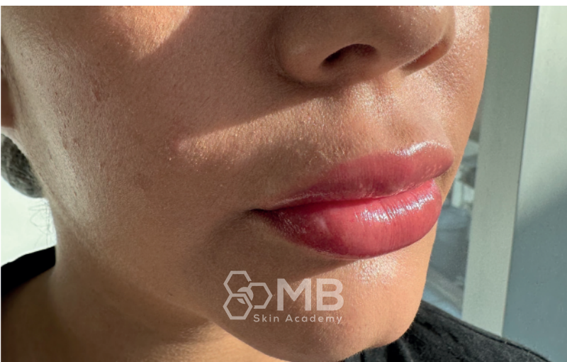
Lip Plumping Enhancer Nude