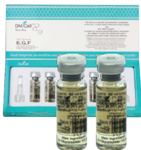
2x Ampollas Skin Renewal 3% EGF (6 aplicaciones)