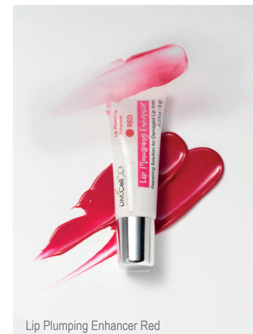
Lip Plumping Enhancer Red