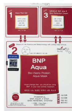
6x BNP Aqua Set - 3 Steps (6 aplicaciones)