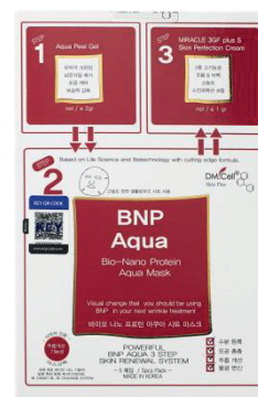
6x BNP Aqua Set - 3 Steps (6 aplicaciones)