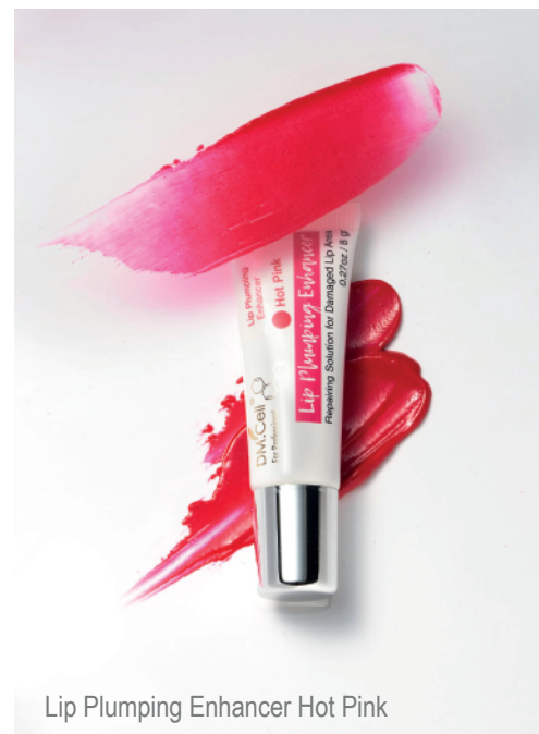
Lip Plumping Enhancer Hot Pink

Protocolo de trabajo Aplicado BBlips Lip Plumping Enhancer