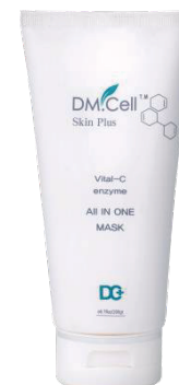
Vital C All-in-One Mask 180ml