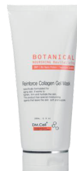
Re - Inforce Collagen Mask 180ml