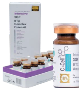
1x Ampollas 5GF BTX 18% Complex Essensit (6 aplicaciones)