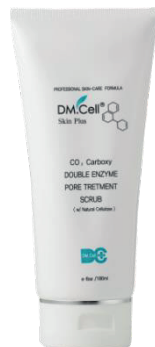
Carboxy Double Pore Treatment 180ml