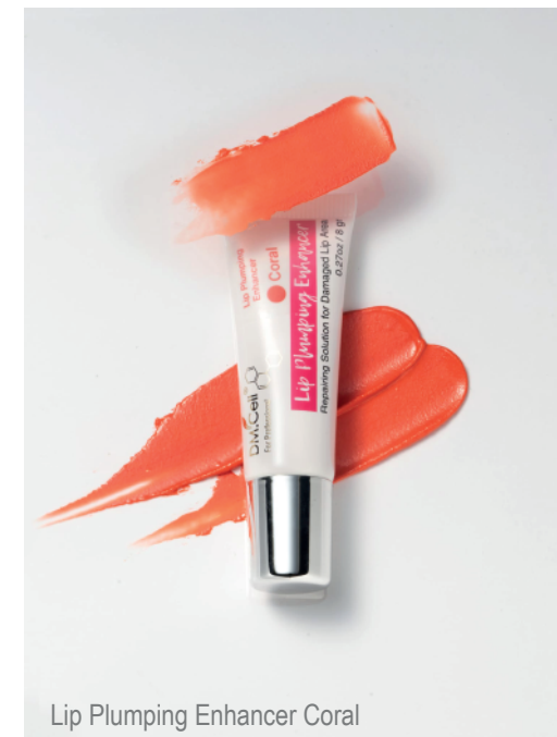
Lip Plumping Enhancer Coral