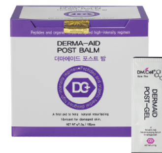
5x Sachet Dermaid Post Balm 1,5gr c/u

* PLAZO MÁXIMO PARA LA ADQUISICIÓN DEL KIT CON DESCUENTO ES DE 6 MESES POSTERIOR AL DÍA DEL CURSO.