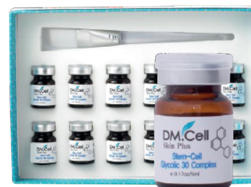
1x Ampolla Glycolic Stemcell 30% Complex