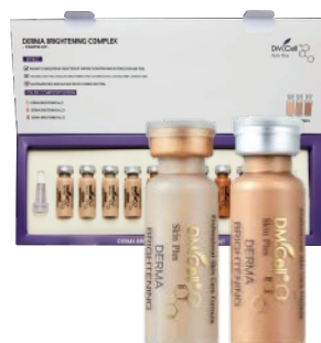
2x Ampolla Dermabrightening Complex (6 aplicaciones)