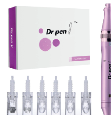
Dr. Pen Ultima M7-W (inalambrico) + 6 cartuchos nano aguja

* PLAZO MÁXIMO PARA LA ADQUISICIÓN DEL KIT CON DESCUENTO ES DE 6 MESES POSTERIOR AL DÍA DEL CURSO.