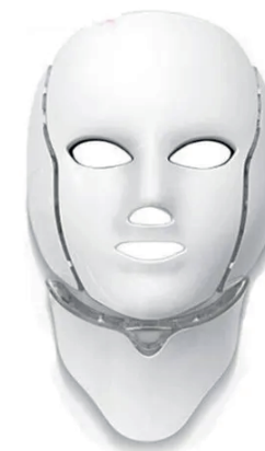
Máscara Fototerapia LED 7 colores