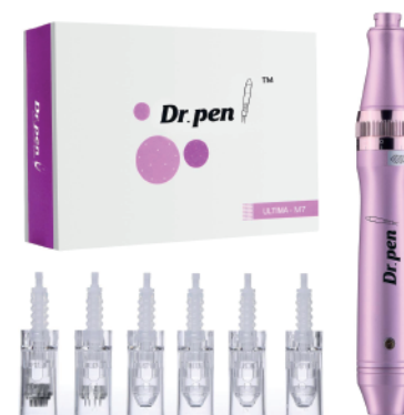
Dr. Pen Ultima M7-W (inalambrico) + 6 cartuchos nano aguja

* PLAZO MÁXIMO PARA LA ADQUISICIÓN DEL KIT CON DESCUENTO ES DE 6 MESES POSTERIOR AL DÍA DEL CURSO.