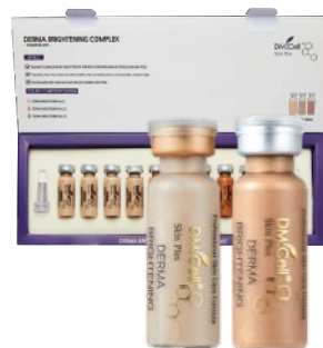
2x Ampolla Dermabrightening Complex (6 aplicaciones)