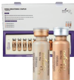
2x Ampolla Dermabrightening Complex (6 aplicaciones)