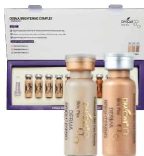
2x Ampolla Dermabrightening Complex (6 aplicaciones)