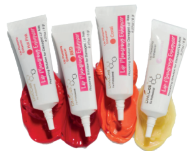
1x Lip Plumping Enhancer (Tono a elección)