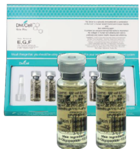
2x Ampollas Skin Renewal 3% EGF (6 aplicaciones)