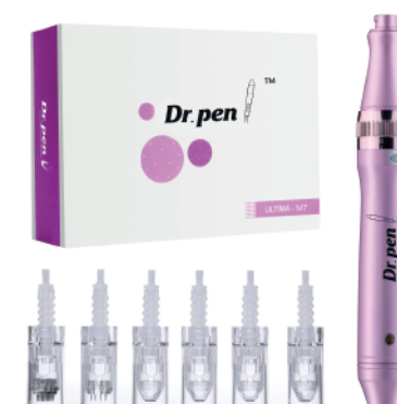
Dr. Pen Ultima M7-W (inalambrico) + 6 cartuchos nano aguja

* PLAZO MÁXIMO PARA LA ADQUISICIÓN DEL KIT CON DESCUENTO ES DE 6 MESES POSTERIOR AL DÍA DEL CURSO.