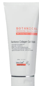
Re - Inforce Collagen Mask 180ml