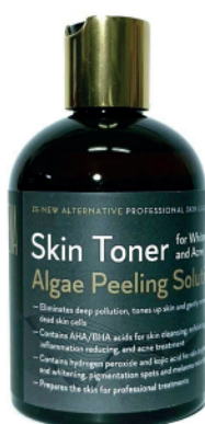
Skin Toner 300ml