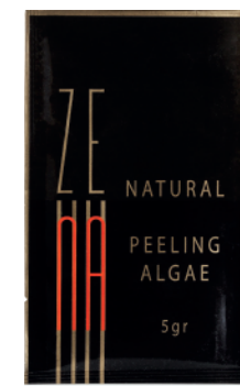
10x sachet Peeling de Algas Zena 5gr c/u