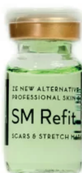
1x Ampolla Scars and Stretch Marks Solution 8ml (SM Refit)