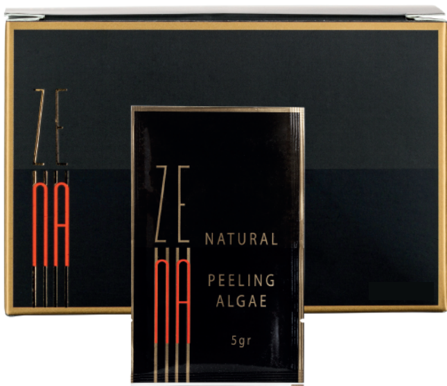
5x sachet Peeling de Algas Zena 5gr c/u

Opción 1: Kit protocolo Básico: $75.055 (IVA Incluido.)(15% Dcto) - Precio normal $88.300.