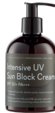
Intensive UV Sun Block Cream 300ml