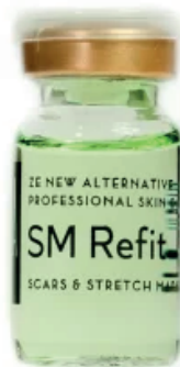
1x Ampolla Scars and Stretch Marks Solution 8ml (SM Refit)