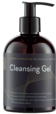
Cleansing Gel 300ml