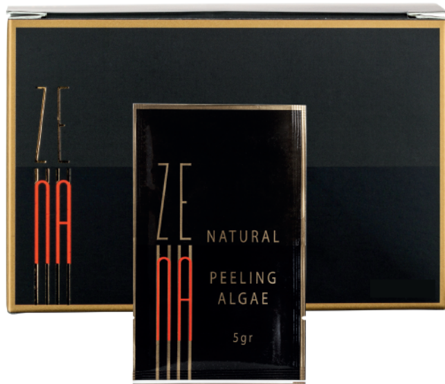
5x sachet Peeling de Algas Zena 5gr c/u

Opción 1: Kit protocolo Básico: $75.055 (IVA Incluido.)(15% Dcto) - Precio normal $88.300.