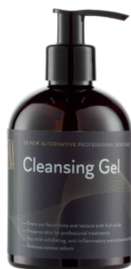
Cleansing Gel 300ml