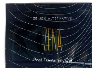
20x sachet gel post tratamiento Zena 2gr c/u

* PLAZO MÁXIMO PARA LA ADQUISICIÓN DEL KIT CON DESCUENTO ES DE 6 MESES POSTERIOR AL DÍA DEL CURSO.