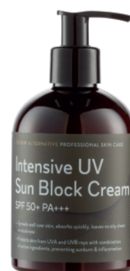
Intensive UV Sun Block Cream 300ml