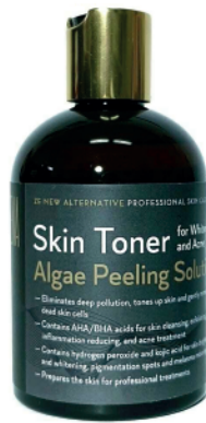
Skin Toner 300ml