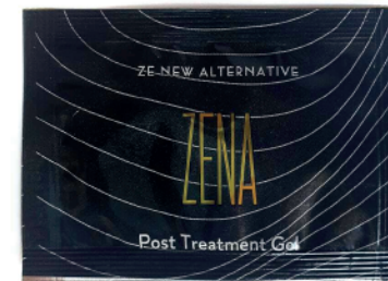
20x sachet gel post tratamiento Zena 2gr c/u

* PLAZO MÁXIMO PARA LA ADQUISICIÓN DEL KIT CON DESCUENTO ES DE 6 MESES POSTERIOR AL DÍA DEL CURSO.