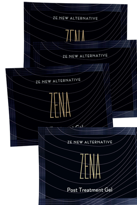
20x sachet gel post tratamiento Zena 2gr c/u

* Referencia: Los sachet de peeling rinden aprox. 10 sesiones en zona facial 15-20 sesiones en zona axilar.