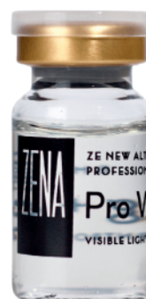
1x Ampolla Pro Whitening 8ml