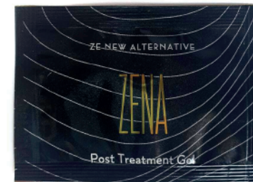
20x sachet gel post tratamiento Zena 2gr c/u

* Referencia: Los sachet de peeling rinden aprox. 20 sesiones en zona facial 30-40 sesiones en zona axilar.