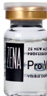
1x Ampolla Pro Whitening 8ml